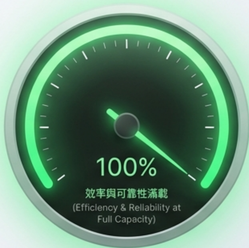
外在表現 (External Performance)