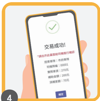
4 交易成功，完成抵扣車資！