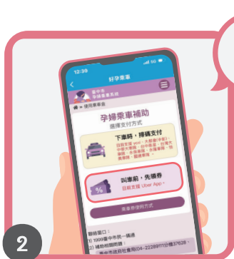
2 點選叫車前，先領券 • 每次限兌換 1 張乘車券 • 乘車券有效期限為 2 小時 如超過期限請重新兌換