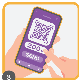
3 掃描QRcode 或 手動輸入乘車資訊